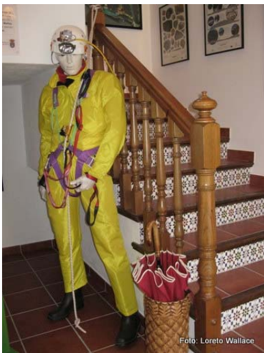
Maniquí con equipamiento de espeleólogo