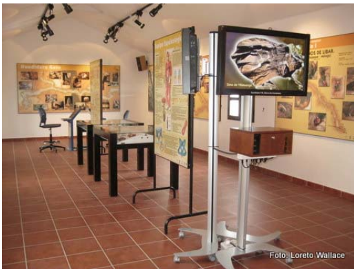
Vista de una de las salas de la planta alta.