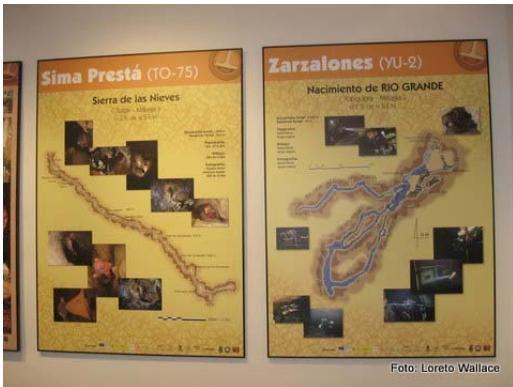
Paneles de cavidades singulares del Parque.