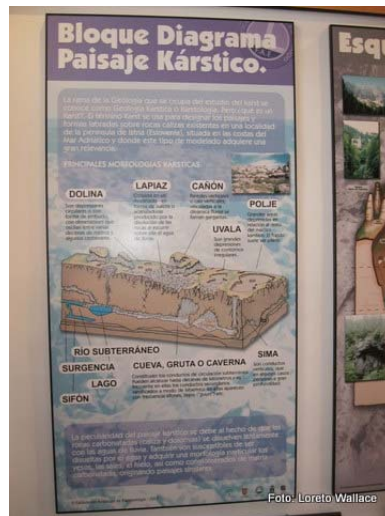
Panel en la zona de escalera