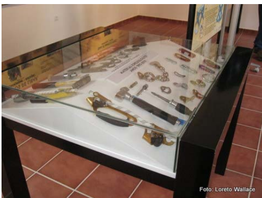
Detalle de una vitrina con material de uso espeleológico.