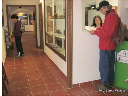
Recepción y Punto de Información Municipal.