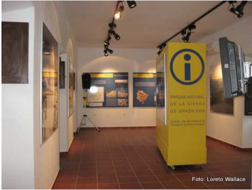
Sala con los contenidos de interpretación del Parque Sierra de Grazalema.