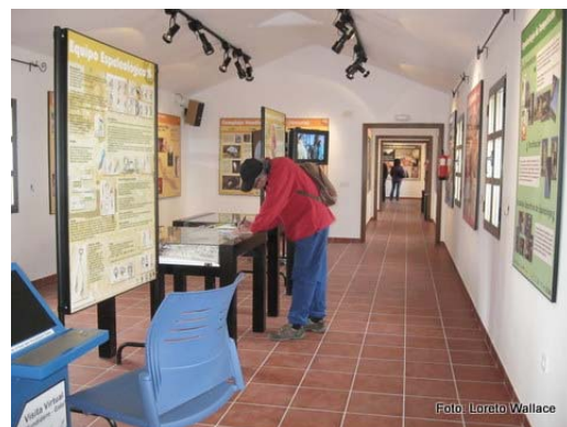
Vista general de las salas del primer piso.