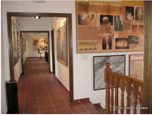
Pasillo Planta Alta