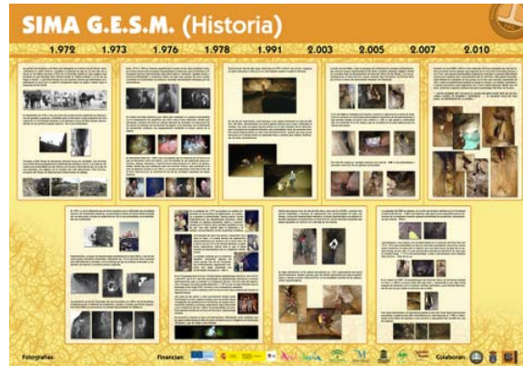
Sima G.E.S.M fue la primera sima de más de 1000 metros de profundidad explorada por un equipo español.