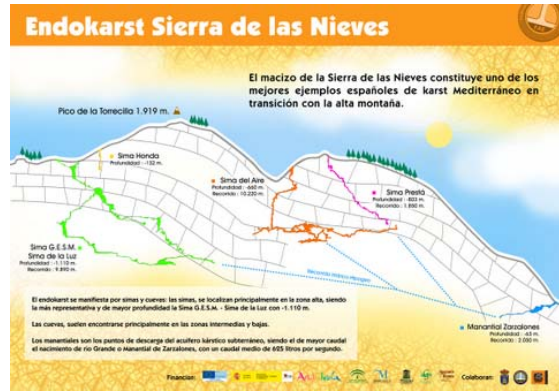
Diagrama del Endokarst Sierra de las Nieves.