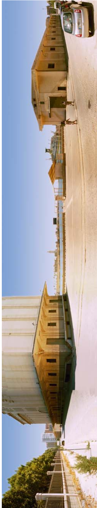
Vista general del lugar de celebración de la prueba

Federación Andaluza de Espeleología c/ Martínez nº 7, entreplanta, oficina 7 29005-MÁLAGA Teléfono 902 367 363 Fax 952 21 19 60 www:espeleo.com - E-mail: fae@espeleo.com